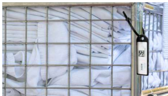
Suivi de chariots