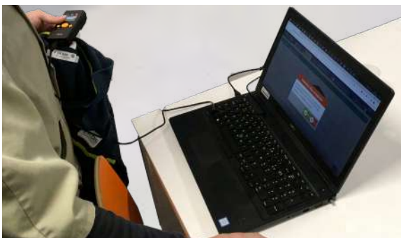
Inventaire de linge plat