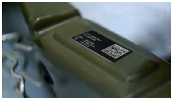
MCO du matériel roulant