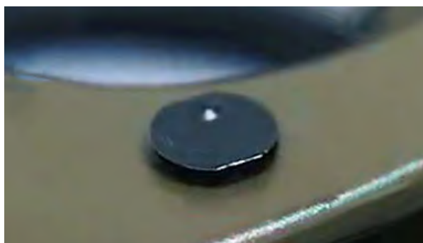
Maintenance d'équipements de l'armée de Terre