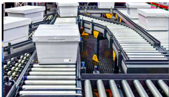
Identification de caisses navettes sur convoyeurs