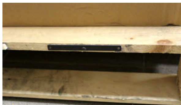
Identification de palettes