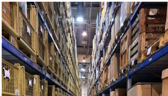
Traçabilité des stocks en magasin