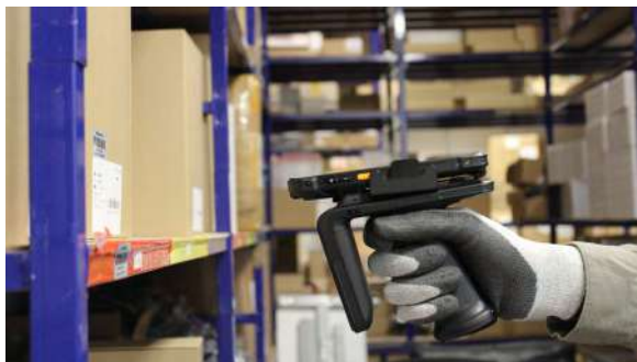
Inventaire sur rayonnages