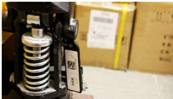
Traçabilité de machines